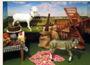
Tischlein deck dich