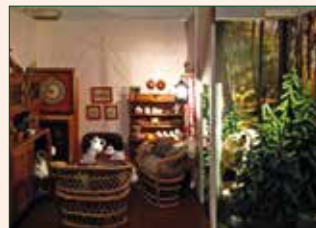
Der Wolf und die sieben Geißlein