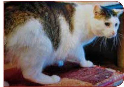
Gustav — 10 Jahre alter Kater, kastriert, sehr verschmust, sucht liebevolles Zuhause.

Kastration ist sowohl bei Freigängern als auch bei Wohnungskatzen sinnvoll -> das Markieren bleibt aus. -> Kastration ist heute ein Routineeingriff