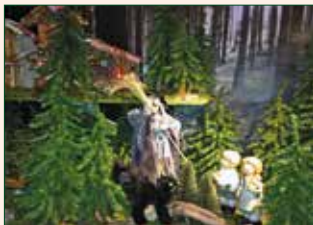
Hänsel und Gretel