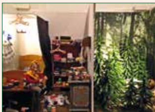
Das tapfere Schneiderlein

Neben der Standuhr von Mutter Ziege, dem Hexenhaus, dem Zwergenhaus, den Riesen, dem Prinzen entstand natürlich auch das neue Weißenfels Schloss, ach nein es ist natürlich Dornröschens Schloss, als Unikat.