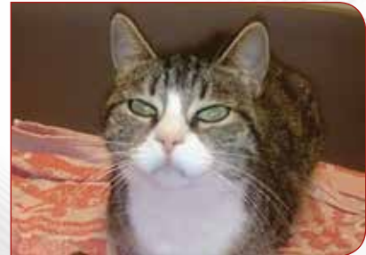
Hermine — ist eine Fundkatze, verschmust, aber auch eigenwillig.