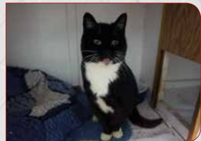
Anika — hat ein Handicap, sie hat eine Entzündung im Mäulchen und wird ärztlich behandelt. Sie ist ca. 10 Jahre alt und zutraulich.